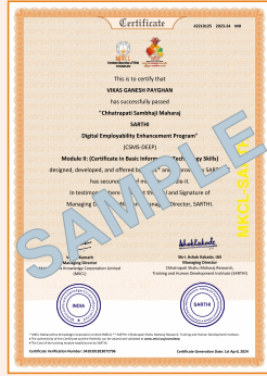
Module wise Certificate